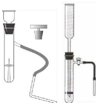
Рис. 7. Прибор для получения и собирания газов

Прибор для получения газов используется для получения небольших количеств газов: водорода, кислорода (из пероксида водорода), углекислого газа.