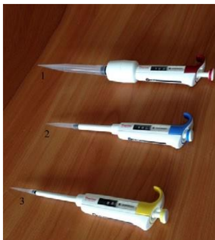
Рис. 5. Пипетки дозаторы одноканальные переменного объёма: 1 — 110 мл; 2 — 100—1000 мкл; 3 — 10—100 мкл.

Пипетка-дозатор — приспособление, используемое в лаборатории для отмеривания определённого объёма жидкости. Пипетки выпускаются переменного и постоянного объёма. В комплекты оборудования для медицинских классов входят удобные пипетки-дозаторы одноканальные, позволяющие настроить необходимый объём отбираемой жидкости в трёх различных диапазонах (рис. 6). Использование современных технологий и цветовой кодировки диапазона дозирования даёт возможность качественно, точно, безопасно выполнять пипетирование. Пипетки имеют сменные пластиковые наконечники.