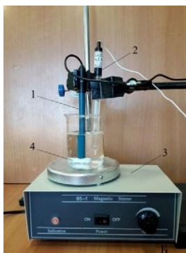
Рис. 2. Установка для определения концентрации (активности) хлоридионов в растворе. А: 1 — корпус датчика для определения \text{Cl}^- -ионов; 2 — разъём Micro USB для подключения к компьютеру; 3 — разъём BNC для подключения рабочего электрода; 4 — разъём для подключения электрода сравнения. Б: 1 — ионоселективный электрод (рабочий электрод); 2 — электрод сравнения (хлорсеребряный электрод); 3 — магнитная мешалка; 4 — якорь магнитной мешалки

Запрещается трогать мембрану электрода пальцами и приводить её в соприкосновение с твёрдыми поверхностями. При хранении ИСЭ чувствительная часть датчика (мембрана) должна быть защищена специальным колпачком. Не допускается использовать электроды с полимерной мембраной в средах, содержащих летучие вещества или органические растворители. Не следует использовать ИСЭ в сильных окислителях. Длительное нахождение ИСЭ в растворах крепких кислот или щелочей приводит к резкому и необратимому сокращению срока службы электрода.